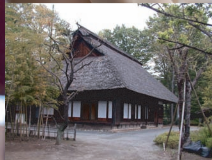
エーファー・ツェルナー 古民家園